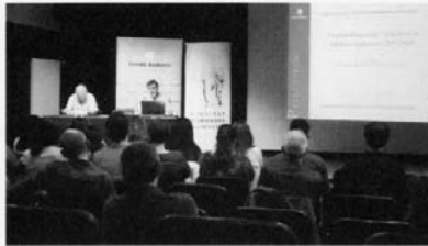
Les XXI jornades de la SAC.

En els darrers anys, el flux de dades i objectes d'estudi s'ha incrementat exponencialment gràcies a l'aparició de nous instruments per a mesurar estadístiques. Per aquest motiu i coincidint amb l'aprovació del projecte de llei del pla d'estadística 2017-2020, la Societat Andorranca de Ciències (SAC) ha centrat les XXI jornades de la SAC en les estadístiques d'Andorra. Un esdeveniment que s'ha dividit en dinou ponències diferents durant la tarda d'aquest divendres al Centre cultural la Llacuna.