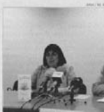
Arquet Mach, ara.

En aquest apartat una de les ponències més destacades és la que abordarà la negociació de l'acord d'associació amb la Unió Europea des del punt de vista de l'estadística. Segons va explicar el coordinador del departament d'Estadística, ca-