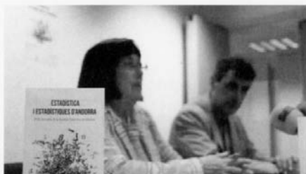
El tríptic de la 2a edició de les jornades.